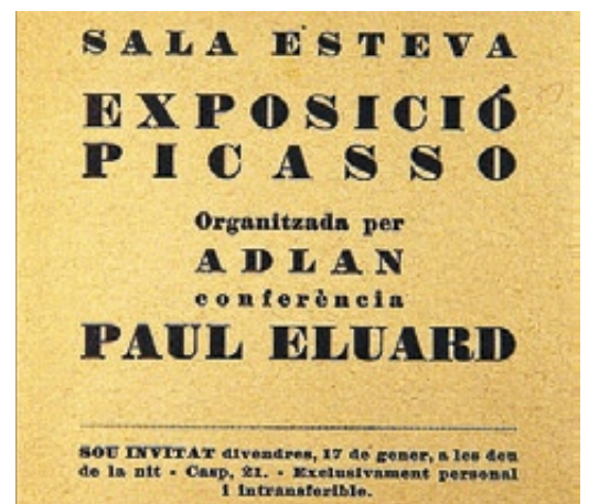
►► A l'esquerra, 'Dona amb gos', de Bonnard. A dalt, un document de l'exposició de Picasso del 36. A sota, una acció de Perejaume.