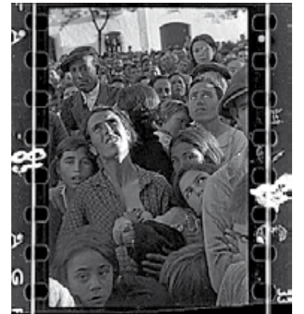
►► A l'esquerra, 'La Masia', de Joan Miró. A dalt, 'Mare alletant el seu nadó mentre escolta un discurs polític a prop de Badajoz', fotografia feta per David Seymour l'abril o el maig del 1936.